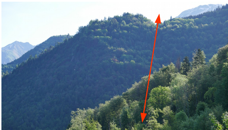
traversée de la combe du Boulangeard et partie haute à fort dénivelé