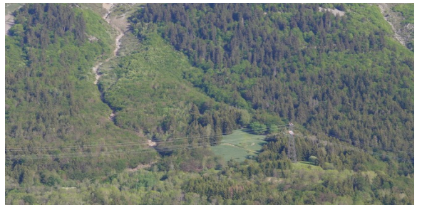
impact actuel des lignes THT du barrage du Verney >