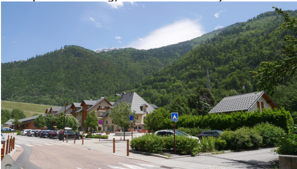
RD 526 dans le centre bourg