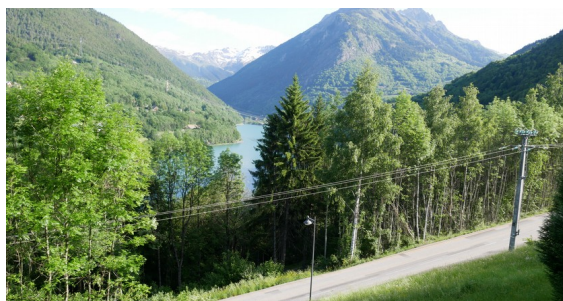
< vue nord-ouest sur lac du Verney depuis la parcelle Labbé (ligne MT existante et maintenue)